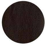
EK08 Testa di moro